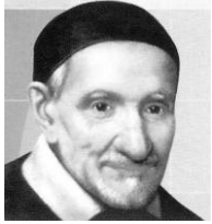
Saint Vincent de Paul (1581-1660)