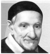
Saint Vincent de Paul (1581-1660)