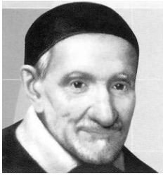
Saint Vincent de Paul (1581-1660)