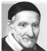
Saint Vincent de Paul (1581-1660)

Dimanche 23 Octobre au Samedi 29 Octobre 2011 à LISIEUX