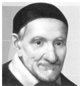
Saint Vincent de Paul (1581-1660)

Dimanche 23 Octobre au Samedi 29 Octobre 2011 à LISIEUX