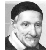
Saint Vincent de Paul (1581-1660)

Dimanche 23 Octobre au Samedi 29 Octobre 2011 à LISIEUX